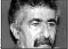
چنگل خواب باران می بندد ستارگان کایس هواب مروه. بر گزردن صدها سال را، تصور کرد من چه خانه حلان می برند کوره های آتش، سوزناخته های منی شود و زانگاه هرگز به خانه باز نمی گردند با من یا تا زمینت شنیدم یا خونم تا کشته مژگان را با کلاب و لکت نویسم